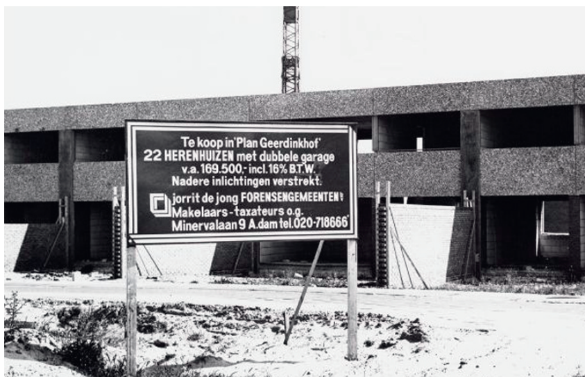
Herenhuizen te koop, deelgebied 3