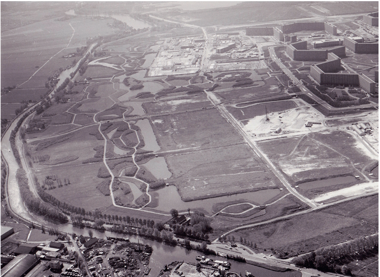
Luchtfoto Bijlmerweide 1973, Geerdinkhof is nog niet gebouwd, de Garstkamp is in aanbouw