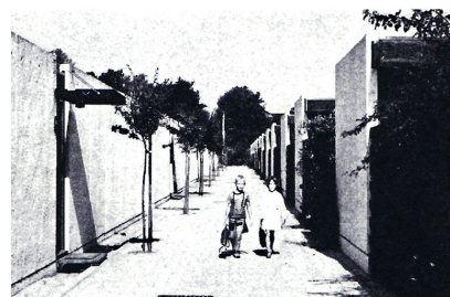
De wijk Albertslund in Kopenhagen diende als inspiratie voor het ontwerp van Geerdinkhof