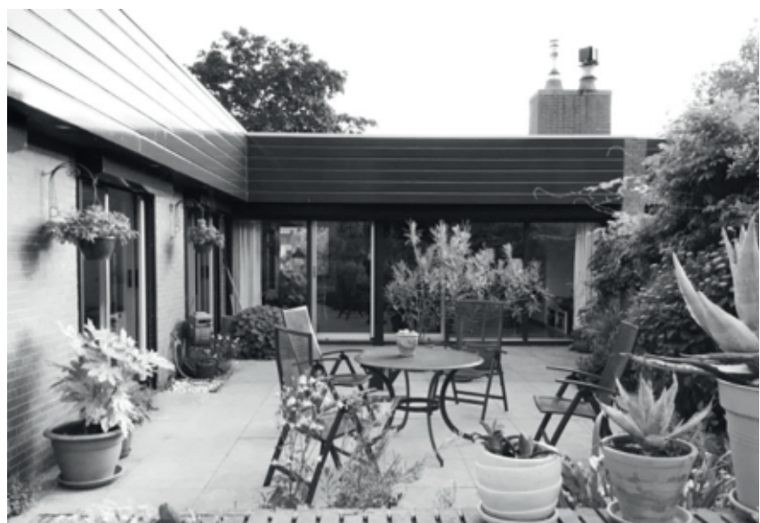
Fig. 5 - Patio van bungalows type C

Met al deze verschillen is er een opvallende overeenkomst. Overal heeft hij - op dat moment zeer moderne - uitgewassen beigebruine grindbetonplaten toegepast, en verticale penanten van glad en donkerbruin beton. Kopwanden