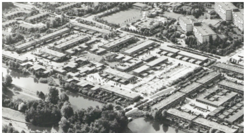
Fig. 4 - Detail van luchtfoto Geerdinkhof, De huizen langs het Ganzenhoefpad zijn in aanbouw, 1986