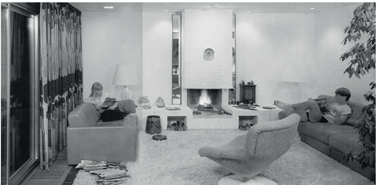
Fig. 7 -Interieurfoto type C uit verkoopbrochure De Koning, ca. 1982