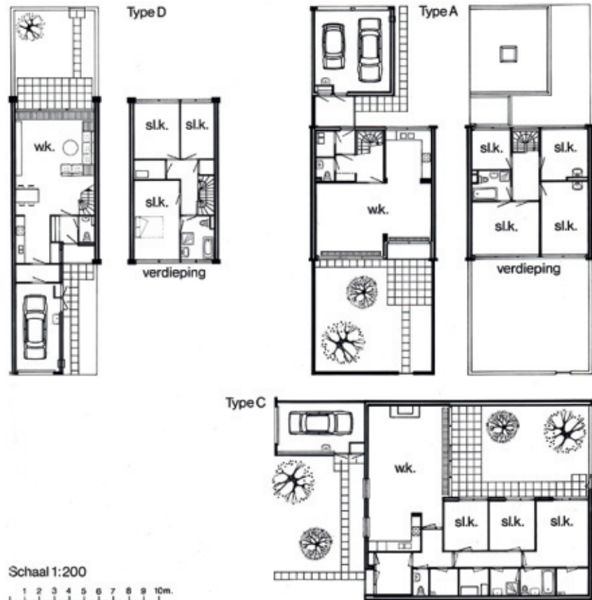
Fig. 6 - Plattegronden typen A, C en D uit verkoopbrochure De Koning, ca. 1982