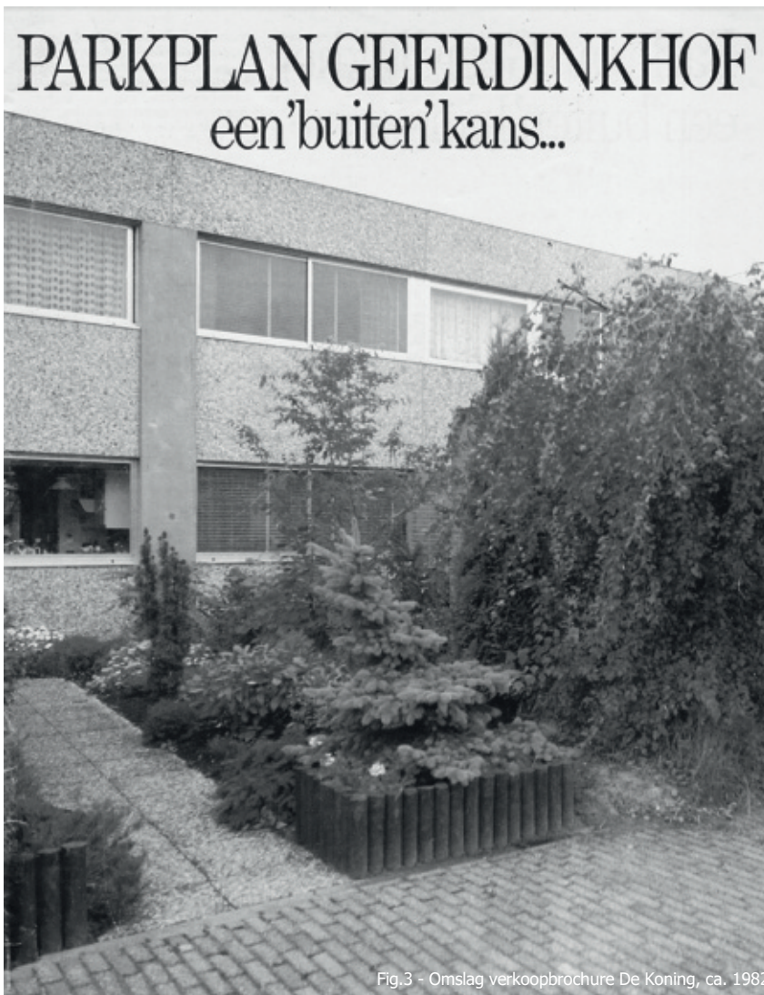
Fig.3 - Omslag verkoopbrochure De Koning, ca. 1982

bestemmingsplan van 2005 genoemd architect Roelof Zeeman op basis van de Dekeukeleire's tekeningen de rest van de bouw begeleid. Deze huizen werden tussen 1985 en 1987 opgeleverd, ieder jaar één strookje (fig. 4).