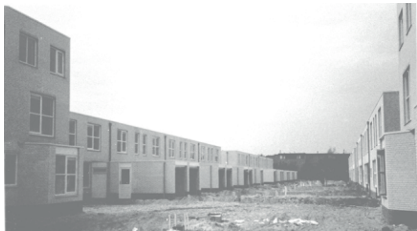
Afb. 5 - Een van de dwarsstraten tijdens de bouw, 1987

In de buurt staan drie typen huizen, A, B en C. De woningen A en B zijn vrijwel identiek, het verschil zit hem in bijge-