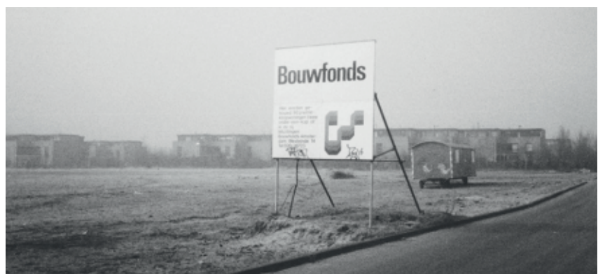
Afb. 2 - Aankondiging huizenverkoop Bouwfonds, 1986

Maar in 1986 zette de NV Bouwfonds Nederlandse Gemeenten een verkoopbord op het terrein en maakte een prospectus voor de buurt (afb. 2). Het Fonds had het project van Bakker overgenomen, en trad hierna op als investeerder, bouwer en verkoper. Wat is het Bouwfonds precies?