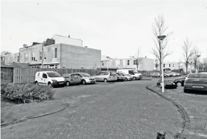
Afb.6 - Toegangsweg met linksvoor het laatste openbare groentje

heeft veel gebouwd in lichte, geelachtige baksteen en met strakke lijnen, zoals in de jaren tachtig ook de mode was (afb. 5).