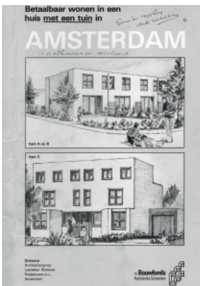
Afb. 4 - Woningtypen uit prospectus Bouwfonds

kopers ervoor gewaarschuwd dat geluid van hakken op een kale betonnen vloer burens kan irriteren, als die niet gewend zijn aan de stilte van een nieuwbouwwijk.