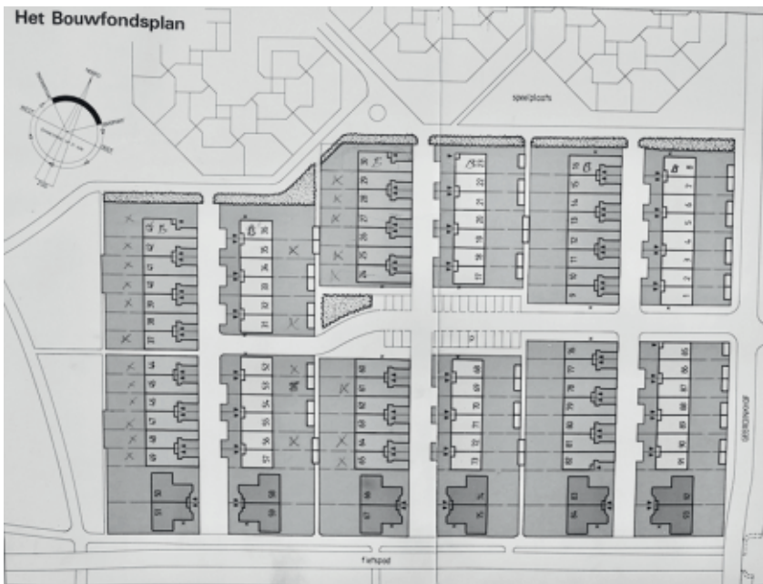
Afb. 3 - Situatietekening uit prospectus Bouwfonds