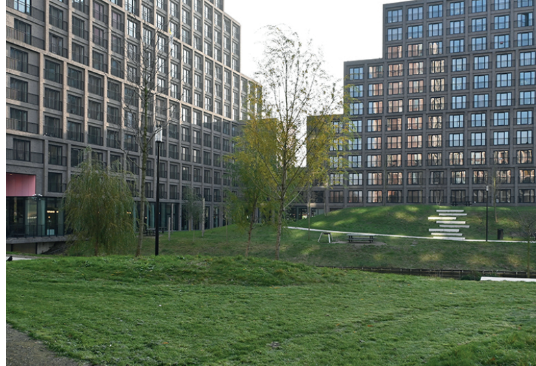
East House gezien vanuit het park