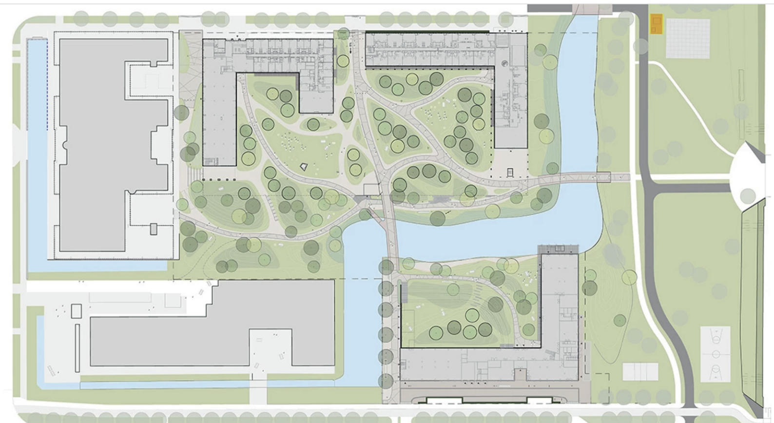
Plattegrond van Our Domain. Rechts onder East House aan de Meibergdreef tegenover het AMC, rechtsboven North House en links daarvan West House, het park met waterloop ertussenin. De twee gebouwen links horen niet bij het complex, de metrolijn loopt rechts. (tekening van website Karres en Brands)