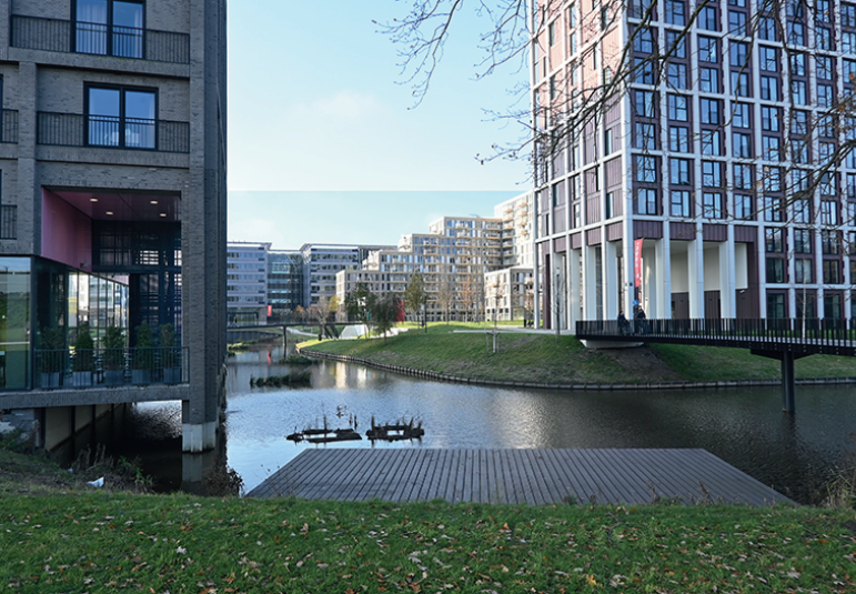
Zicht tussen East House en North House door op het park