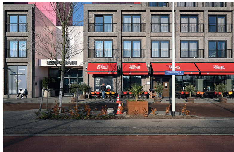
Entree OurDomain en terras Miss Scarlett