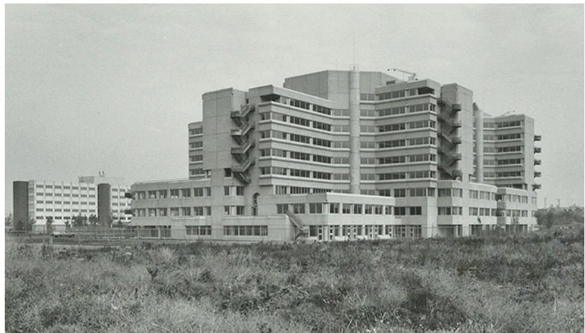
Holendrecht Centre vlak na de bouw in 1982

Opeens was het er, en uw verslaggever heeft zich er meermalen over verwonderd. Wie schetst onze verbazing toen fotograaf Jaap Schippers en ik voor de vorige aflevering van deze rubriek rond het AMC liepen en pal aan de overkant deze kleurige krachtpatser zagen staan. Een kijkje binnen en eromheen was genoeg: dit complex is een plekje in onze rubriek zeker waard.