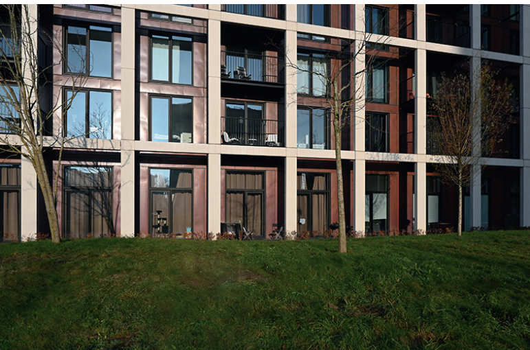
Appartementen in North House gezien vanuit het park