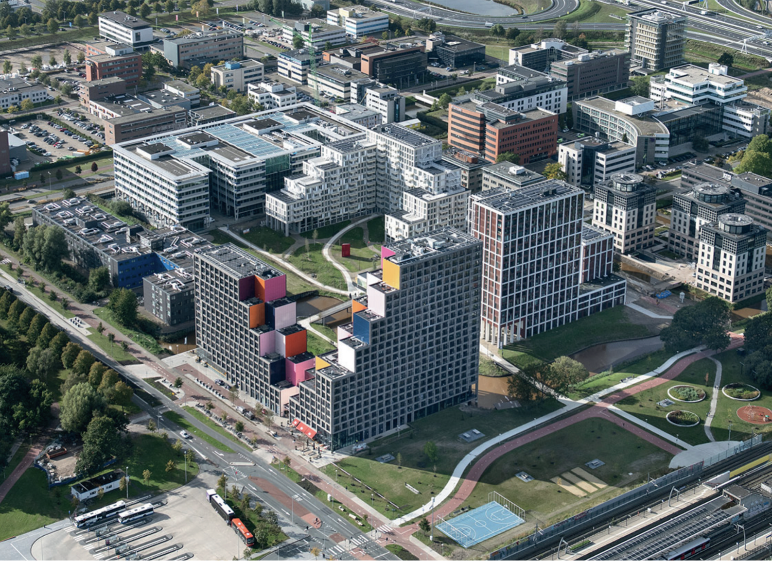
OurDomain in 2022