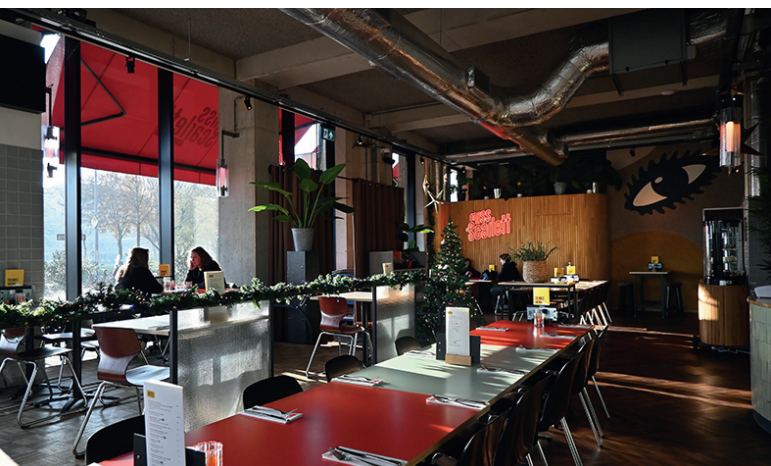
Café-restaurant Miss Scarlett