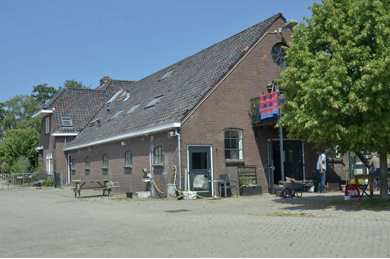
Provincialeweg 56 Van Waveren