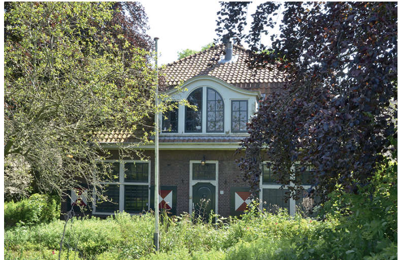
Provincialeweg 22-24 Langerlust