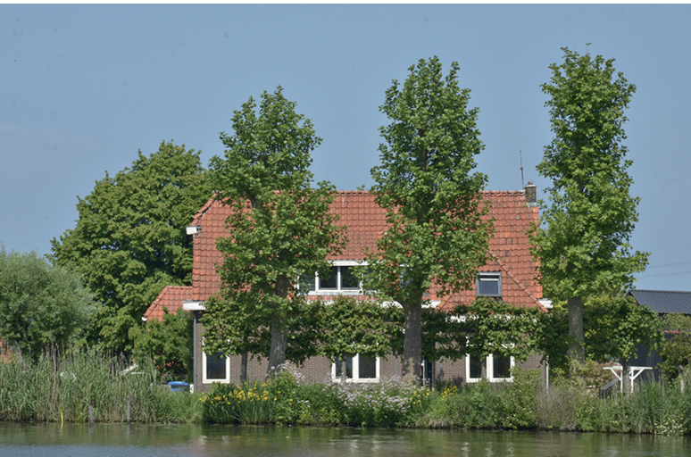
Lange Stammerdijk 28 Palestina