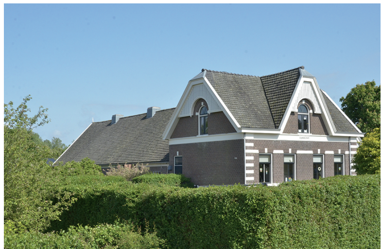
Stammerdijk 25 Landlust