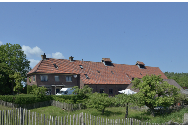
Stammerdijk 36 Over Bijlmer