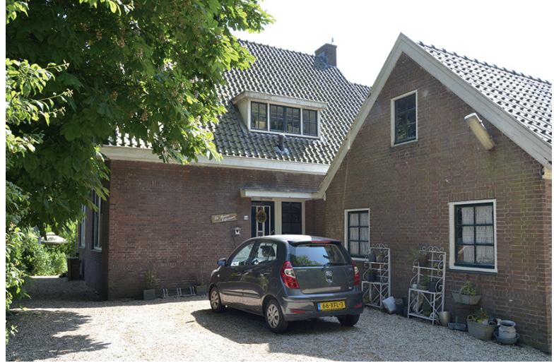
Provinciale weg 44