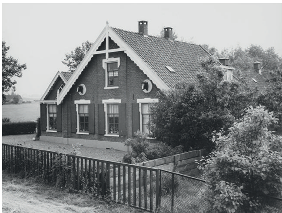
Connais toi même (ken uzelve) met een fraaie voorgevel met koeienkoppen en een zomerhuis ernaast, vóór de sloop

Een mooi voorbeeld van een - helaas - gesloopte boerderij is Connais toi même , die vanaf eind 19de eeuw op het terrein van de huidige schooltuinen stond, vlak naast de nog bestaande boerderij.