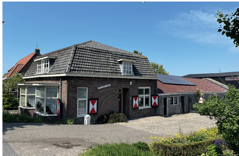
Lange Stammerdijk 26 De Goede Hoop