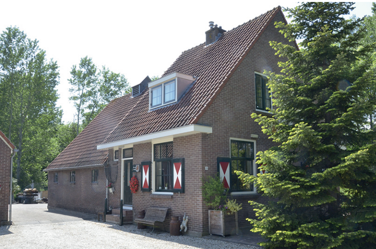
Provinciale weg 35