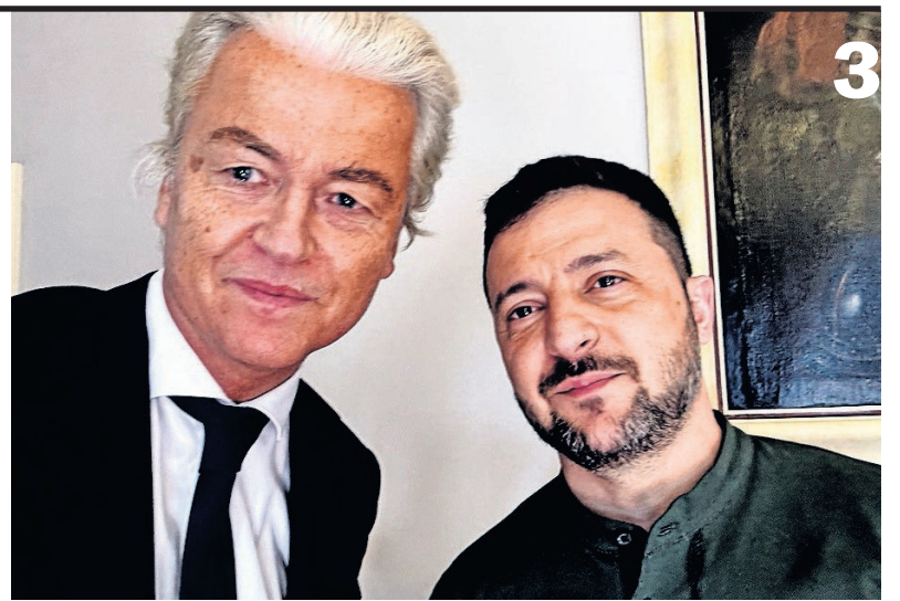
→ Wilders plaatste een selfie met Zelensky op X na afloop van zijn bezoek.