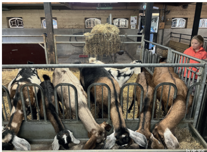
In de stal

We zijn de grootste kinderboerderij in Amsterdam, qua grond, voorzieningen en dieren. Eigenlijk zijn we een visitekaartje van Zuidoost naar de rest van Amsterdam. En ver daarbuiten. We krijgen jaarlijks 40.000-70.000 bezoekers.