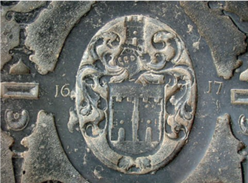
Afbeelding 3: grafsteen van Matthijs Coenraadszoon Burgh, Oude Kerk Amsterdam

beslaat de periode september 1624 tot en met november 1626. In afbeelding 4 een fragment met daarop de aanbetalingen aan de molenaars in 1625.